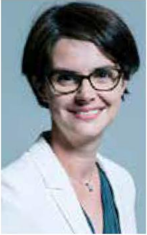
Chloe Smith MP Minister for Disabled People, Health and Work